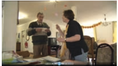
Manchmal schwierige Verständigung

bereits lebenden Menschen und deren Familienmitgliedern „passen“. Die Angehörigen in den WGs praktizieren Selbstverantwortung. Auf diese Weise können sie persönlich die Interessen ihres Familienmitglieds wahrnehmen und zusammen