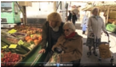
Gemeinsam einkaufen auf dem Markt

Dieses Angebot richtet sich an Menschen, die nicht mehr in ihrer bisherigen Wohnung wohnen wollen oder können, weil Pflege und Betreuung dort nicht zu ge-