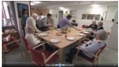
Vor dem Anhängigentreffen gemeinsames Abendessen mit den WG-Mitgliedern