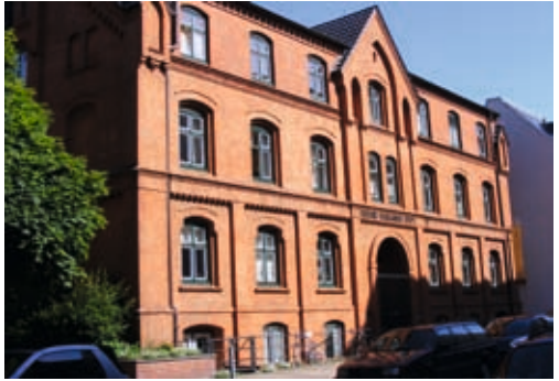
Im Obergeschoss liegen die Räume der WG Pauline Mariannen-Stift

Der Film zeigt das Leben in den Hamburger Wohngemeinschaften Bärenhof und Pauline Mariannen-Stift, wie dort Bewohnerinnen und Bewohner ihren Alltag mit dem festen Betreuungs- und Pfl egeteam verbringen und welche Aufgaben die Angehörigen übernehmen. Auf deren Wunsch werden die in den WGs lebenden Menschen im Film mit Vornamen vorgestellt.