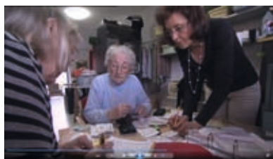
Angehörige bei der Abrechnung

pflegebedürftigen Menschen bzw. deren Angehörige/gesetzlichen Betreuerinnen und Betreuer als Auftraggeber für den dritten Akteur,