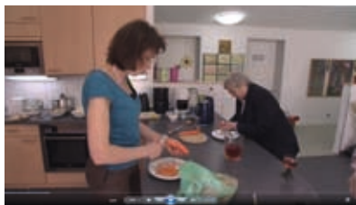
Mithelfen beim Kochen

Wie in klassischen WGs gibt es auch in Pflege-WGs Individual- und Gemeinschaftsbereiche. Gemeinschaftlich genutzt wird die offene Wohnküche, die in ein großes Wohnzimmer übergeht.