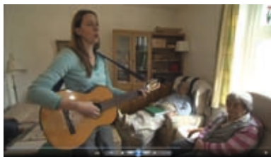
Musiktherapeutin in der WG

Überschaubarkeit ist ein wesentliches Prinzip von WGs. Ein konstantes Team aus Alltagsbetreuern und Pflegekräften vermittelt Vertrautheit. Die einen helfen mit, den Alltag zu strukturieren und die Menschen dort zu begleiten, die anderen sichern die notwendige Pflege – wenn es sein muss, rund um die Uhr. Für jedes Mitglied der WG werden die ambulant erbrachten Pflegeleistungen individuell abgestimmt. Durch gezielte Anregungen und Kontakte, durch persönliche Ansprache und notwendige Hilfestellungen kann angemessen auf vorhandene Bedürfnisse eingegangen werden. Feste Ansprechpartner im Alltag bieten die Chance, sich im neuen sozialen Zusammenhang einzuleben, Verständnis füreinander sowie Vertrauen zueinander zu entwickeln.