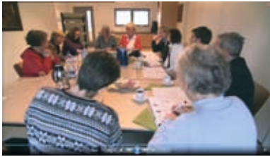
Angehörigentreffen - ein Mal im Monat

die wichtigen Fragen bestimmen, die die Gemeinschaft betreffen. Auch in der Verständigungskultur des WG-Alltags sind Angehörige wichtig. Sie stellen eine Brücke zum Betreuungspersonal dar, wenn ihr Familienmitglied sich nicht mehr selbst artikulieren kann.