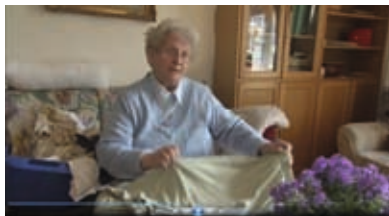
Mitmachen beim Wäsche zusammenlegen

währleisten sind. Es bietet für die, die in eine WG umziehen, besondere Qualitäten der sozialen Teilhabe und der Selbstbestimmung. Auch die Angehörigen können davon profitieren. Sie sind von der Sorge der alltäglichen Rund-um-die-Uhr-Betreuung befreit, können und sollen dort ihr Familienmitglied jedoch weiterhin verantwortlich begleiten.