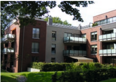
Im Erdgeschoss liegen die Räume der WG Bärenhof

Kaffeeduft zieht durch den großen Wohnraum mit Küche und Esstisch, kurz vor acht. Allmählich kommen die Bewohnerinnen und Bewohner aus ihren Zimmern. Jeder kann schlafen, solange er will, steht irgendwann auf, um am Gemeinschaftsleben teilzuhaben: Einkaufen auf dem Markt, Gemüse schneiden, Wäsche zusammenlegen, Teller abwaschen. Sie verbringen ihren Alltag miteinander, unterstützt durch Pflegekräfte und Begleiter.